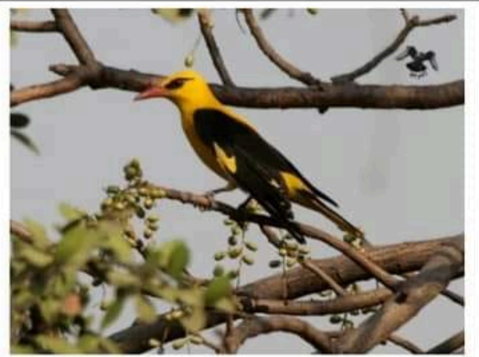
السند 1: طائر الصفاري يتغذى أساسا على الحشرات

إعتادا على الأسناد المقدم إليك ومكتسباتك القبلية أجب عما يلي: