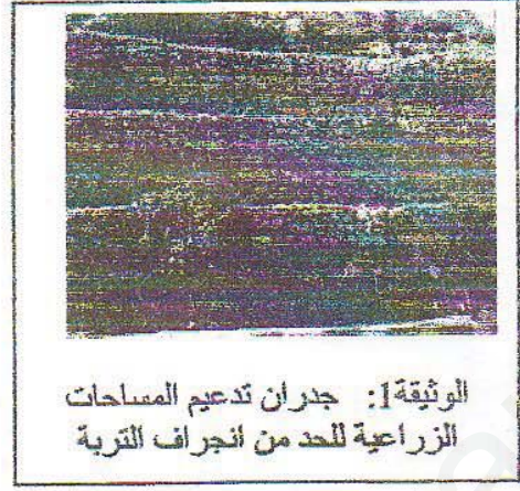
الوثيقة 1: جدران تدعيم المساحات الزراعية للحد من انجراف التربة